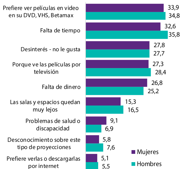
Gráfico 3. Distribución porcentual de razones para no haber ido a cine en los últimos 12 meses, según sexo. Bogotá, 2016